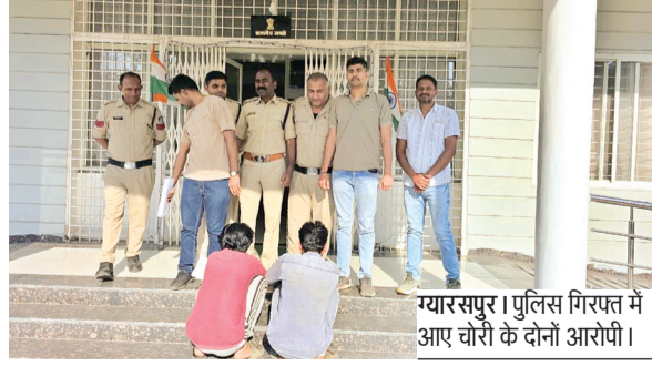
ग्यारसपुर। पुलिस गिरफ्त में आए चोरी के दोनों आरोपी।