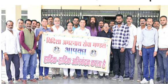
विदिशा। अमरनाथ सेवा मंडल ने कलेक्टर पहुंचकर सौंपा ज्ञापन।