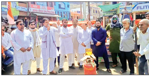
हरिभूमि न्यूज | रायसेन